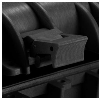
Cierre de presión facil de abrir (a partir del modelo 3818)

Ranuras internas para paneles opcionales con el soporte de ménsula metálicas o marcos para paneles