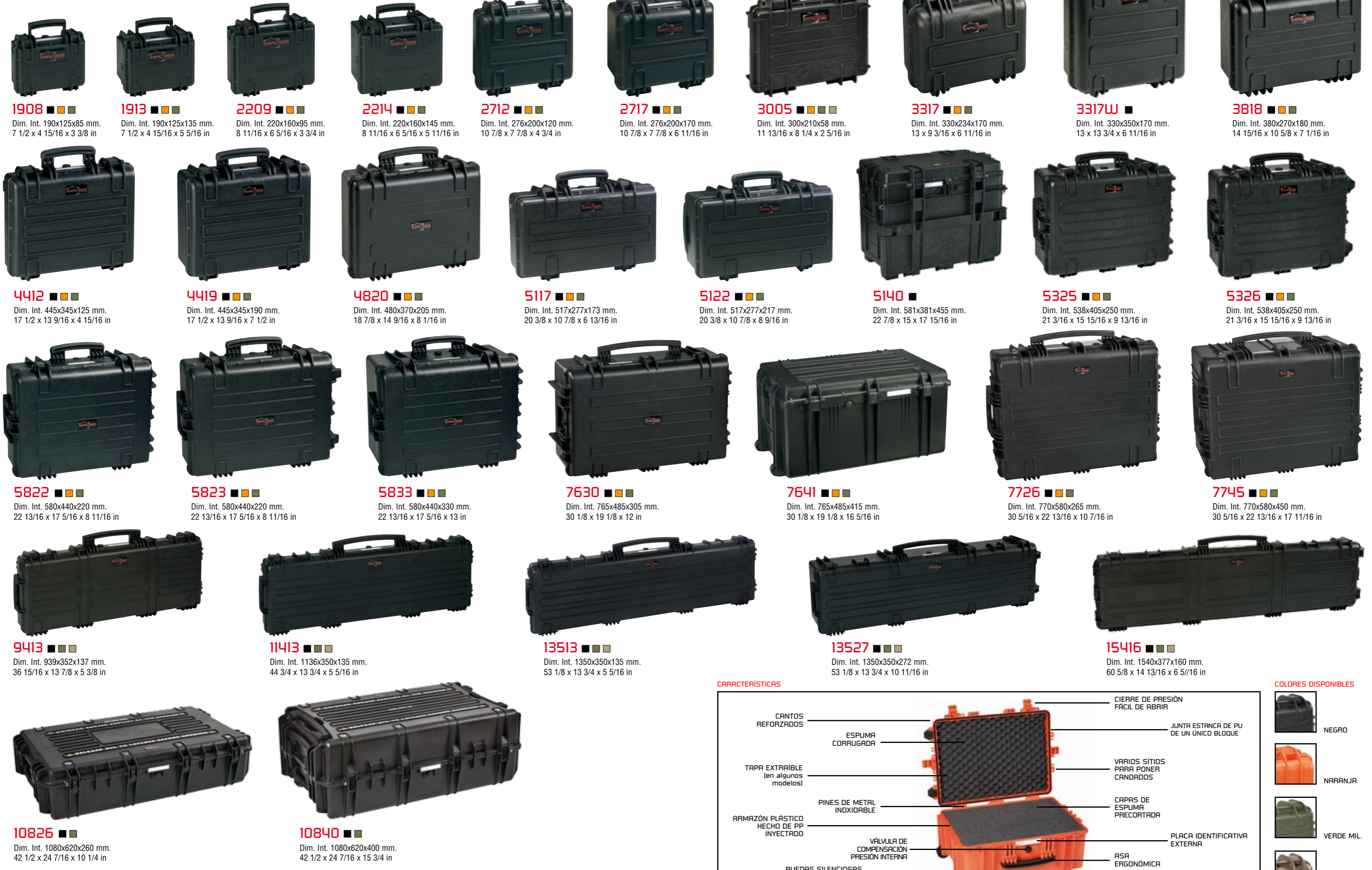
1908 ■■■ Dim. Int. 190x125x85 mm. 7 1/2 x 4 15/16 x 3 3/8 in 1913 ■■■ Dim. Int. 190x125x135 mm. 7 1/2 x 4 15/16 x 5 5/16 in 2209 ■■■ Dim. Int. 220x160x95 mm. 8 11/16 x 6 5/16 x 3 3/4 in 2214 ■■■ Dim. Int. 220x160x145 mm. 8 11/16 x 6 5/16 x 5 11/16 in 2712 ■■■ Dim. Int. 276x200x120 mm. 10 7/8 x 7 7/8 x 4 3/4 in 2717 ■■■ Dim. Int. 276x200x170 mm. 10 7/8 x 7 7/8 x 6 11/16 in 3005 ■■■ Dim. Int. 300x210x58 mm. 11 13/16 x 8 1/4 x 2 5/16 in 3317 ■■■ Dim. Int. 330x234x170 mm. 13 x 9 3/16 x 6 11/16 in 3317W ■■■ Dim. Int. 330x350x170 mm. 13 x 13 3/4 x 6 11/16 in 3818 ■■■ Dim. Int. 380x270x180 mm. 14 15/16 x 10 5/8 x 7 1/16 in